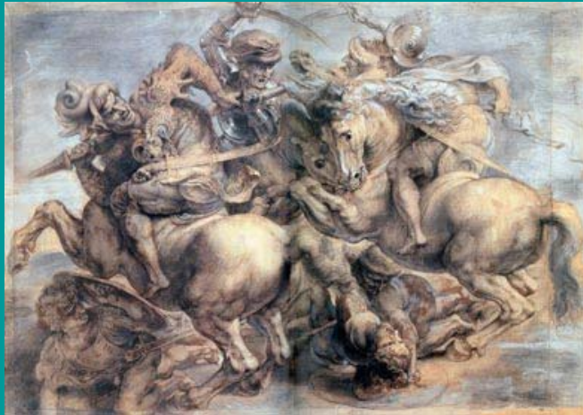
La bataille de Anghiari