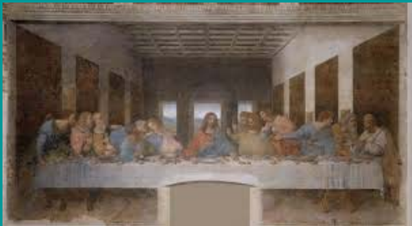
La dernière cène